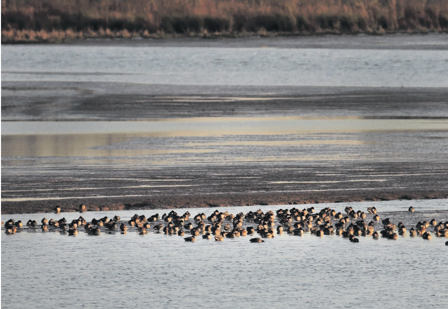
▲ De afgelopen dagen lag er veel slik droog in de Biesbosch, waarvan de wintertaling gretig gebruik maakte.

Door de Deltawerken verminderde de getijslag in de Biesbosch behoorlijk, waardoor het aantal overwinterende wintertalingen zienderogen zakte. Dankzij de vele, onlangs uitgevoerde rivierprojecten, klimt dit fraaie eendje weer uit het dal.