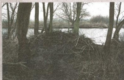
▲ Een van de eerste beverburchten in de Biesbosch.

Zo'n volwassen knager weegt namelijk tussen de 25 en de 30 kilo en meet van kop tot en met de platte staart, ongeveer 1,25 meter. Geen kleintje dus, die bever. Dergelijke afmetingen bestempelen het beest met gemak tot grootste knaagdier van Europa. De paar-