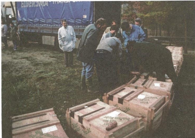
▲ Voor de uitzetting in 1989 werden de bevers in houten kisten vervoerd, waarbij de binnenkant was voorzien van dun plaatstaal.

Vanaf eind oktober 1988 tot en met 1991 zette Staatsbosbeheer 41 bevers in de Biesbosch uit. Om bevers uit te zetten, moet je ze echter eerst hebben! Al de bevers komen uit de voormalige DDR. Van Nature gaat terug in de tijd.